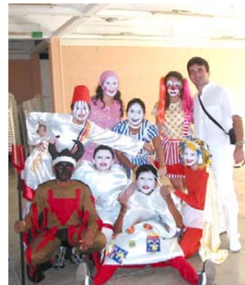
Grupo Arte e Saúde foi a única experiência premiada no Ceará

A Secretaria de Programas e Projetos Culturais do Ministério da Cultura (SPPC/MinC) divulgou os nomes das instituições que receberão o Prêmio Cultura e Saúde, que faz parte do Programa Nacional de Cultura, Educação e Cidadania - Cultura Viva e conta com a parceria do Ministério da Saúde. O Município de Sobral foi premiado através da Escola de Formação em Saúde da Família Visconde de Sabóia (EFSFVS) pela experiência do Grupo Arte e Saúde. O objetivo da premiação era identificar, mapear, divulgar e estimular práticas inovadoras que desenvolvam ações de promoção da saúde por intermédio de atividades culturais, reconhecendo o ser humano como ser integral e a saúde como qualidade de vida.