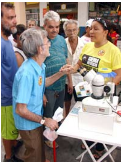
As atividades de panfletagem, aconteceram por todo dia, em vários pontos da cidade

Nesta quarta-feira, 19, a Secretaria da Saúde e Ação Social realizou uma série de atividades educativas em toda a cidade por ocasião do Dia Municipal de Combate a Dengue, instituído pela Lei Municipal Nº 780, de outubro de 2007. Apesar de Sobral apresentar um índice de infestação predial pelo mosquito da Dengue de apenas 0,05%, a Secretaria da Saúde vem promovendo ações de combate ao mosquito e conscientização da